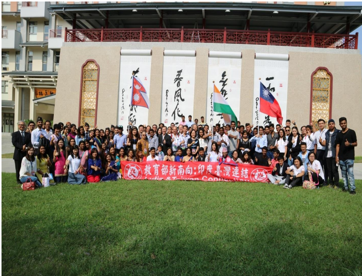
在南華大學中道樓一字畫牆前合照留影