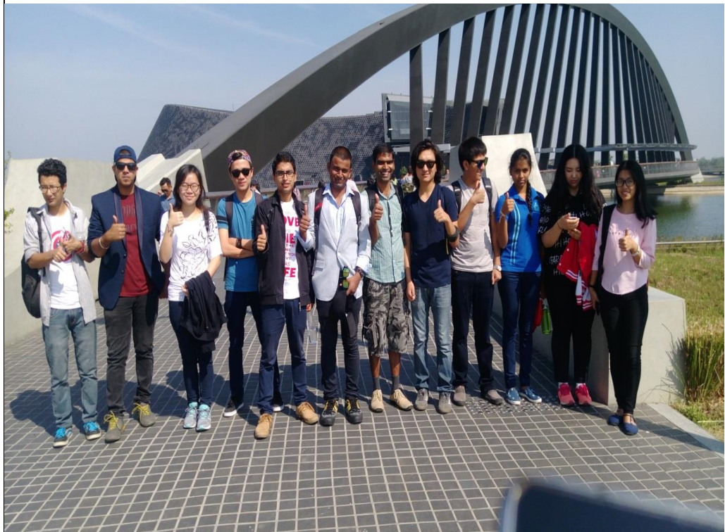
故宮南院參訪留影