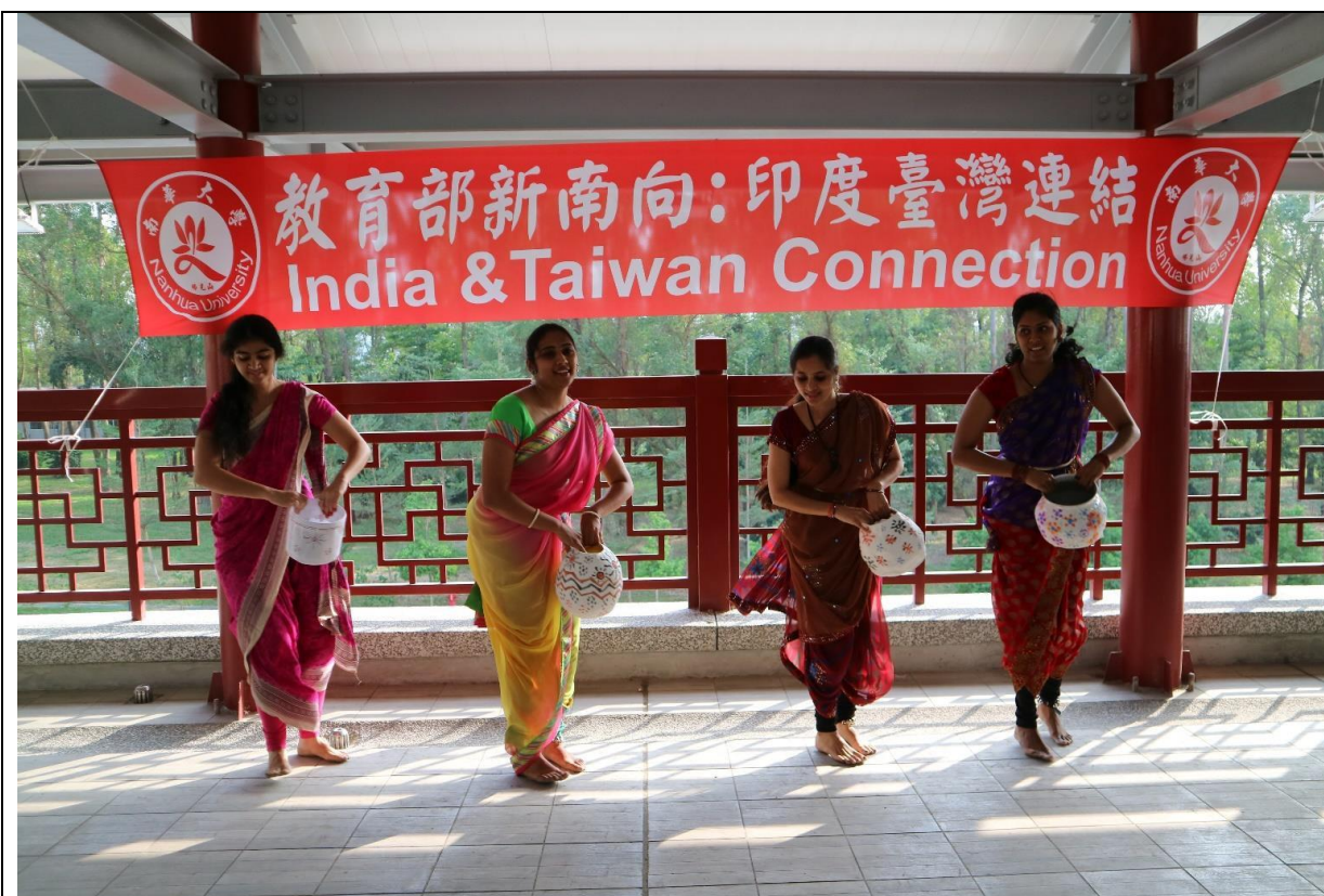
清華大學印度學生展現印度傳統舞蹈表演