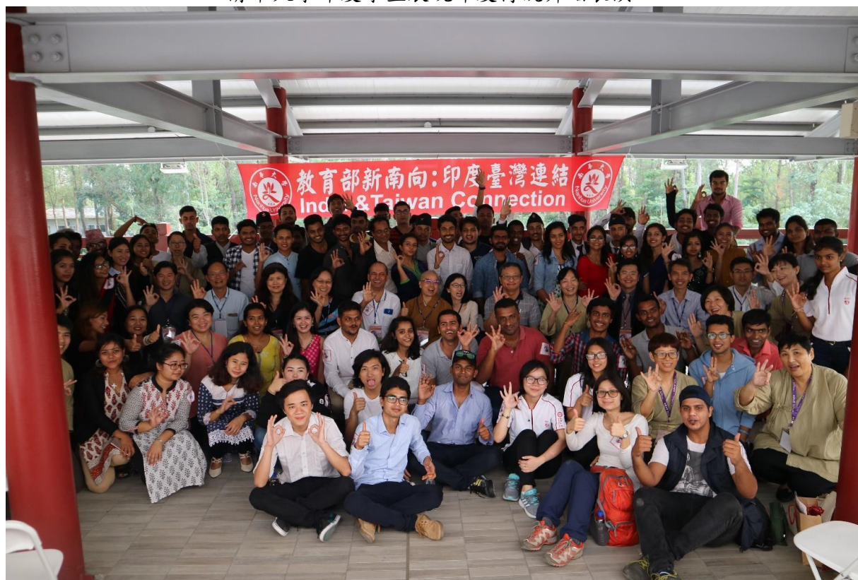
所有與會貴賓與學生近 150人於中道樓觀景台合影