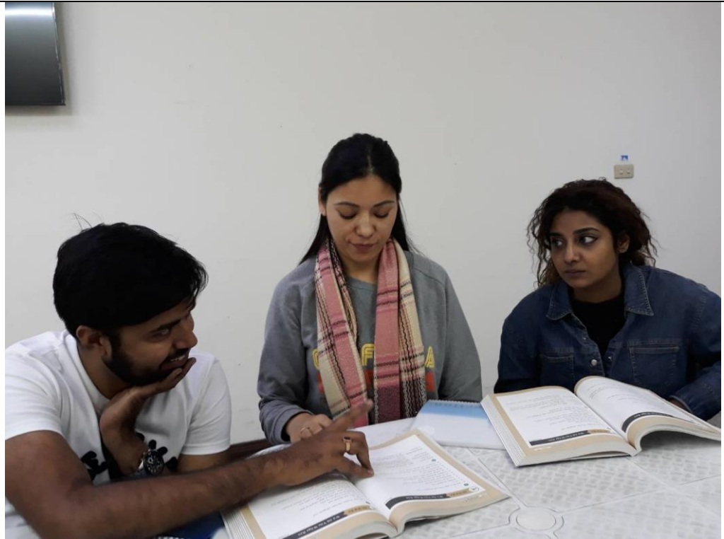
3位學員彼此討論華語課程之內容