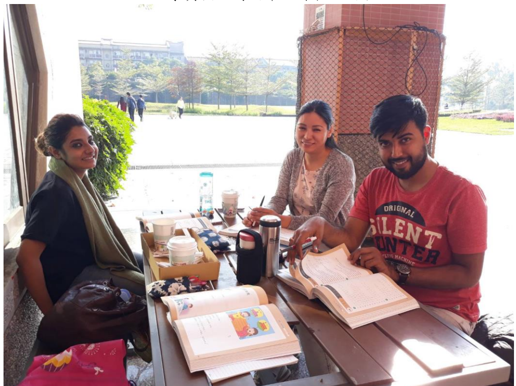
課後之餘，於戶外進行課程討論