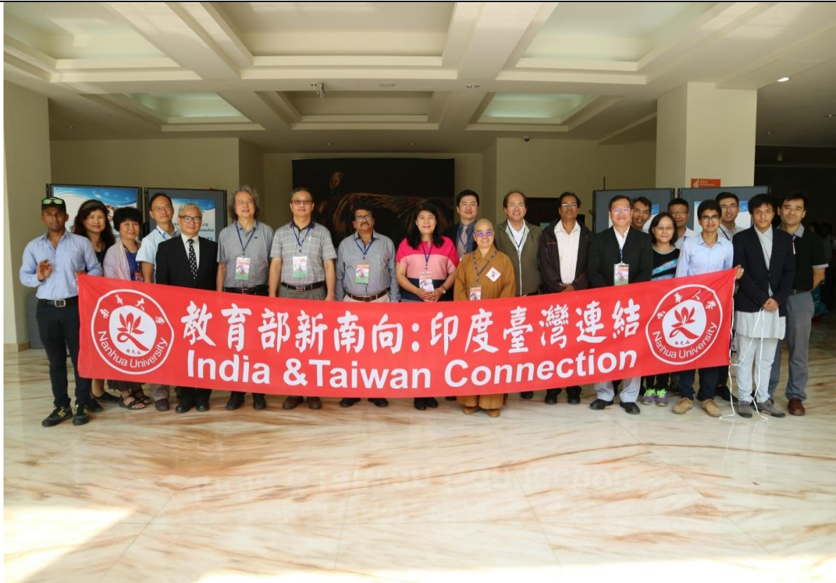
執行長覺明法師與貴賓師長合照於中道樓中庭