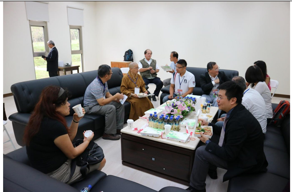
各校貴賓與南華大學各單位主管與系所教授進行交流討論