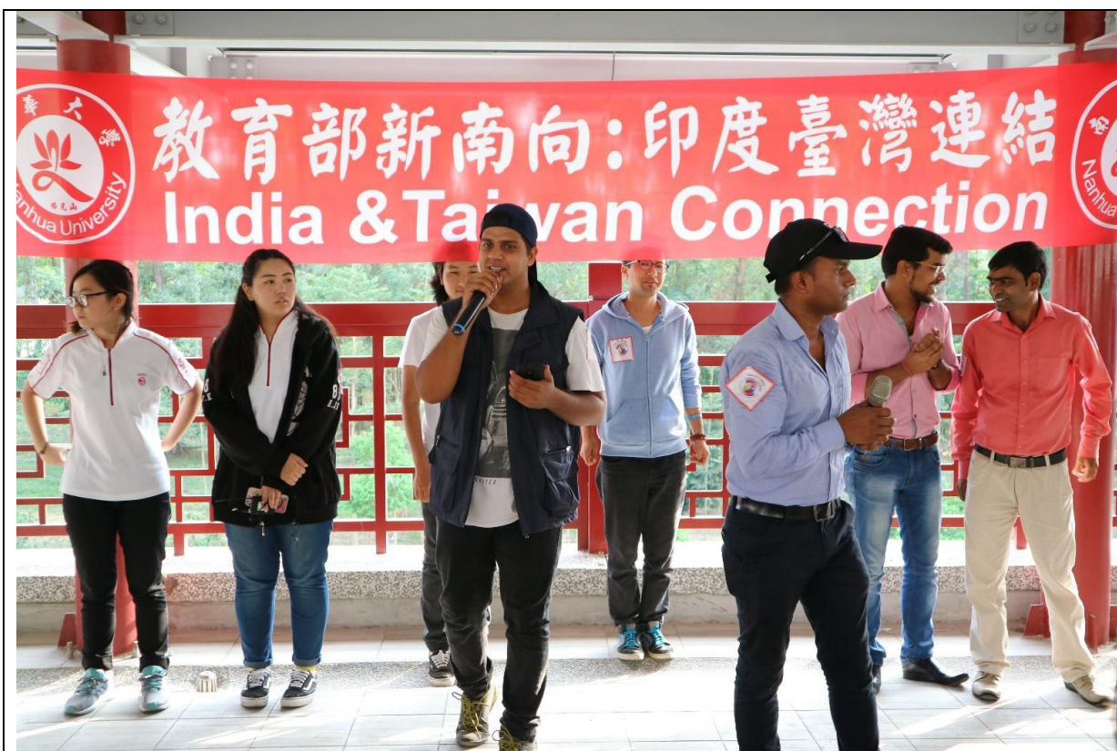
南華大學的南亞學生獻唱〈All is well〉炒熱全場氣氛