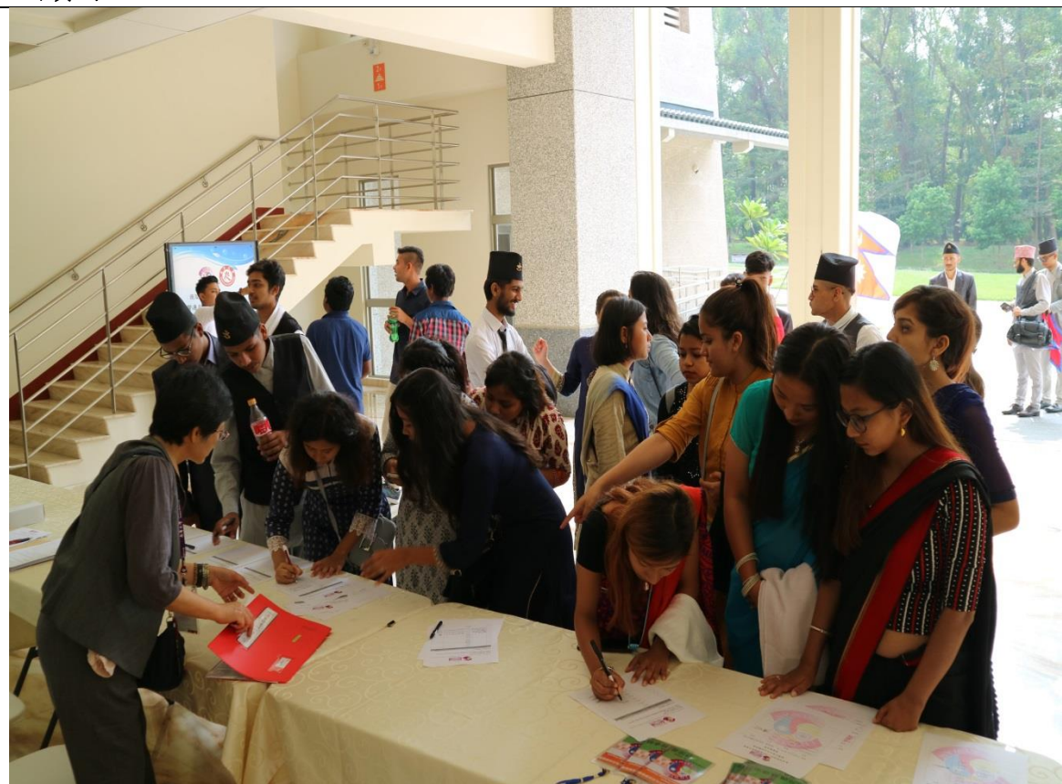
各校學生陸續報到