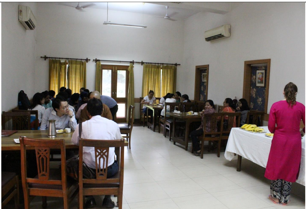
印度臺灣師長與南亞國家家長、學生茶敘聯誼