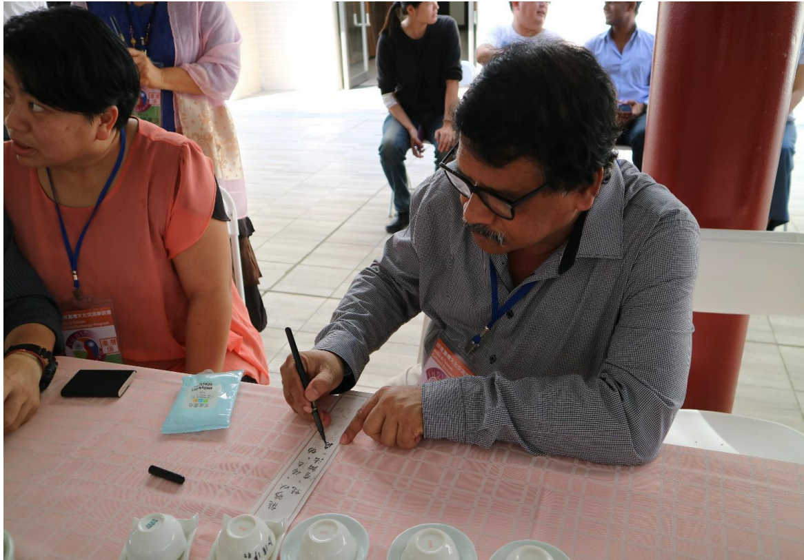
印度 KIIT 大學校長於活動中體驗抄經，了解南華大學生命教育之特色。