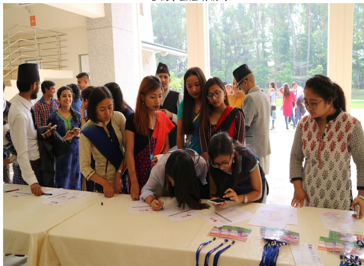
學生穿著代表印度文化的服裝出席這次聯誼會