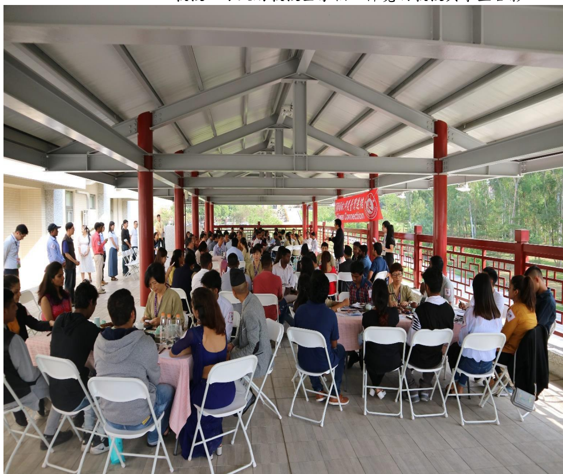
印度文化交流聯誼會於中道樓觀景台舉行，當中安排茶席、抄經與表演等活動。