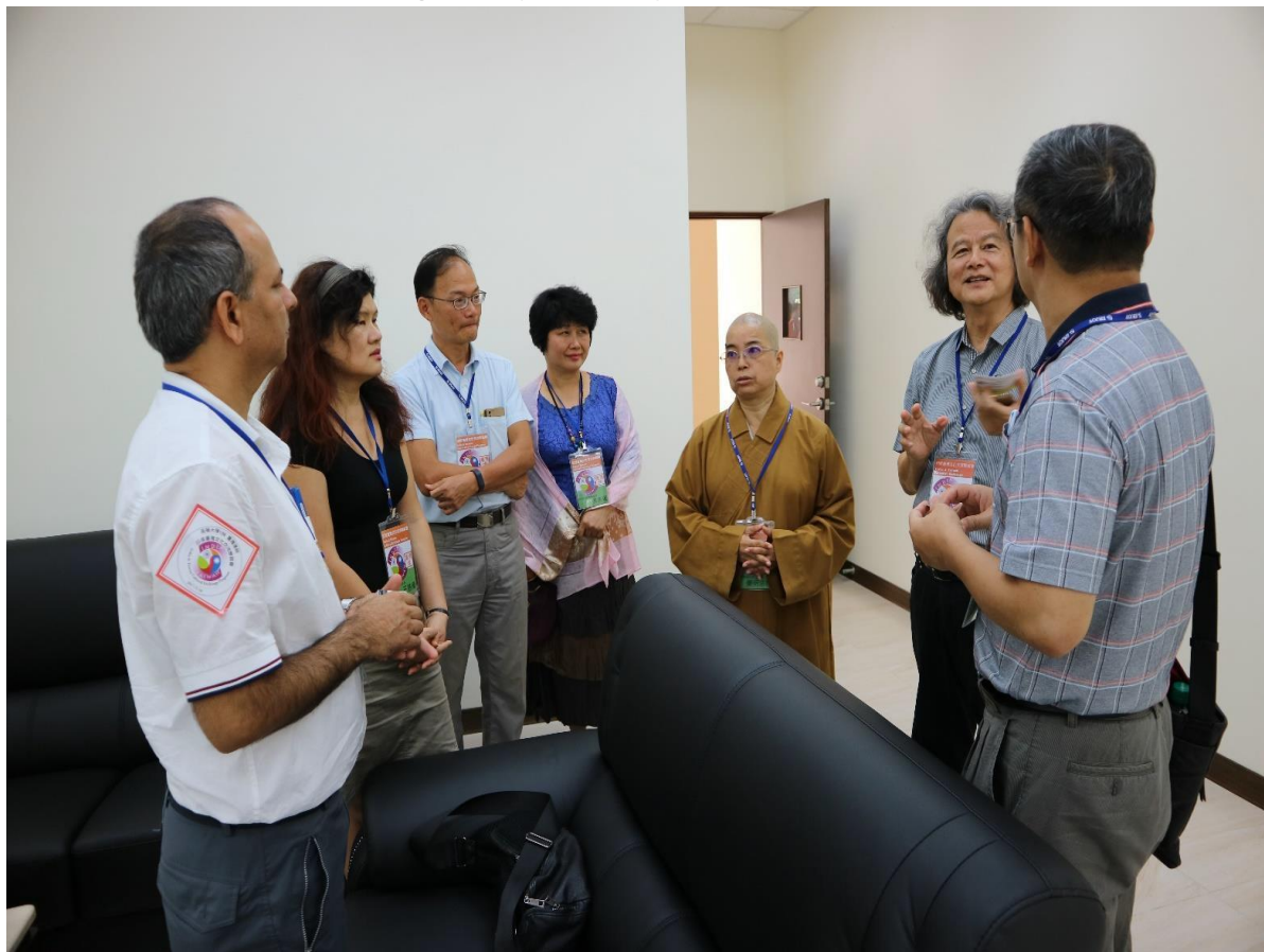
各校貴賓與南華大學各單位主管與系所教授進行交流討論